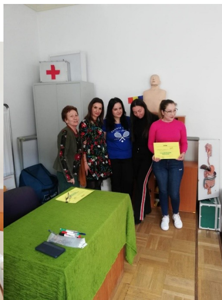
Participanți :SPS „Carol Davila,, Slatina, Caracal, SPS,Christiana,,