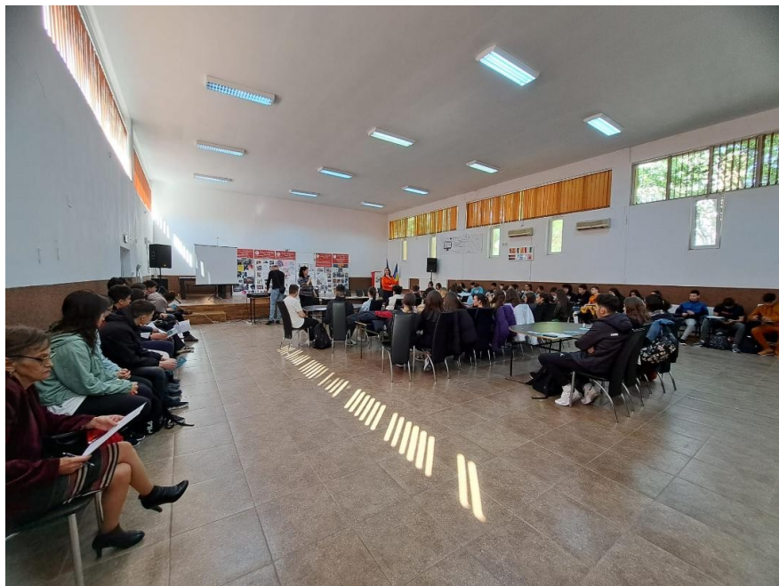
Liceul „Șefan Diaconescu,, Pocolava