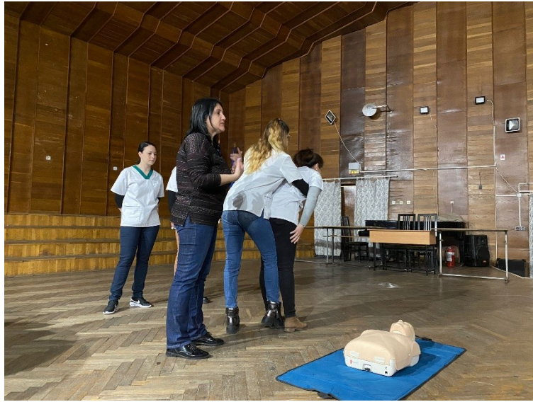
Liceul „P.S. Aurelian,,