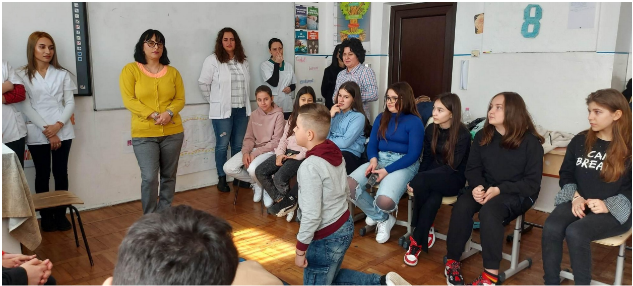
Liceul „Nicolae Titulescu,,